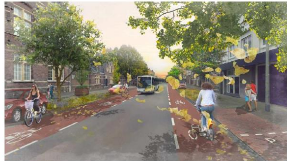
Afbeelding 3.2: Impressie eindbeeld Wilhelminasingel en Sint Maartenslaan

Het tweerichtingen fietspad aan de westzijde van de Franciscus Romanusweg zorgt ervoor dat een deel van de conflicten tussen fietsers en gemotoriseerd verkeer op het kruispunt Franciscus Romanusweg – Wilhelminasingel kan worden opgelost. Dit betreft vooral de conflicten tussen fietsers van de Wilhelminabrug naar de Franciscus Romanusweg en gemotoriseerd verkeer van de Franciscus Romanusweg naar de Wilhelminasingel. Doordat deze verkeersstromen elkaar niet meer kruisen, kunnen bestuurders vanuit de Franciscus Romanusweg zich focussen op verkeer van en naar de Wilhelminasingel. Dit maakt de rijtaak eenvoudiger en het aantal moment waarop risico's worden genomen wordt kleiner. Door een lager aantal conflictpunten, hoeft verkeer minder lang op elkaar te wachten en zal de vertraging in de spits verminderen.